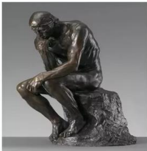
Огюст Роден. Мыслитель

«Dubito ergo cogito, cogito ergo sum» – Я сомневаюсь, значит мыслю; я мыслю, значит существую» (Рене Декарт)