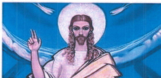
ЖИЗНЬ – как Целостное Экологическое Мировоззрение

Facebook, Igor Cheremisin, Tbilisi -- www.facebook.com/noo.igor