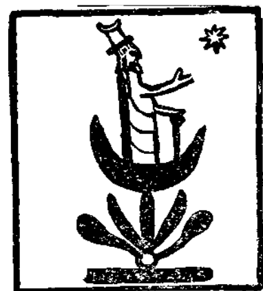
Вавилонский бог луны Син на лунном серпе, опирающемся на символическое пятичастное изображение древа жизни, приветствует звезду Венеру

5/ "Побеждающего сделаю столпом в храме Бога Моего, и он уже не выйдет вон; и напишу на