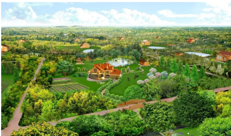
Родовые поместья в Родовом поселении

местий, владельцы которых объединены в общее партнёрство для совместного обустройства Родового поселения, создания соответствующей инфраструктуры. Родовые поселения стали создаваться одновременно в разных регионах России.