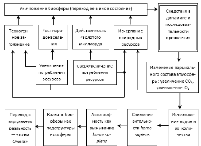
Рис. 2. Тенденции и прогноз изменения биосферы в структуре ноосферы

Пожирание тучных коров тощими. Данная формула Ветхого Завета в нообиологии понимается как процесс уничтожения человеком биосферы в ее гармоническом равновесии, то есть естественной среды обитания homo sapiens как животного вида. Отсюда и известный символ каббалы, сатанизма и масонства – жалящая сама себя змея.