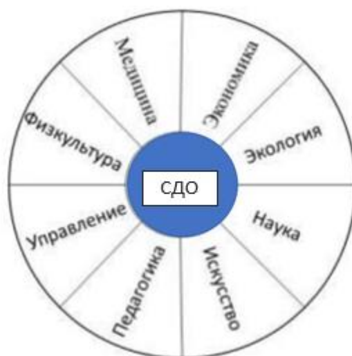
Рисунок 2. Восемь базовых сфер деятельности общества (СДО) [5, с. 16]