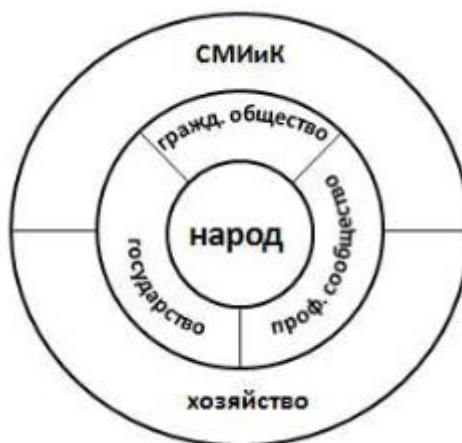
Рисунок 7. Архитектоника социума

Третий слой рассматриваемой архитектуры социума – инфраструктурный. Он обеспечивает общество тремя социально-значимыми потоками: веществом, энергией и информацией. Здесь можно выделить две общественные структуры: хозяйство и средства массовой информации и коммуникации (СМИиК, масс-медиа). Поставкой вещества и энергии преимущественно занято народное хозяйство. Поставкой социальной информации – масс-медиа.