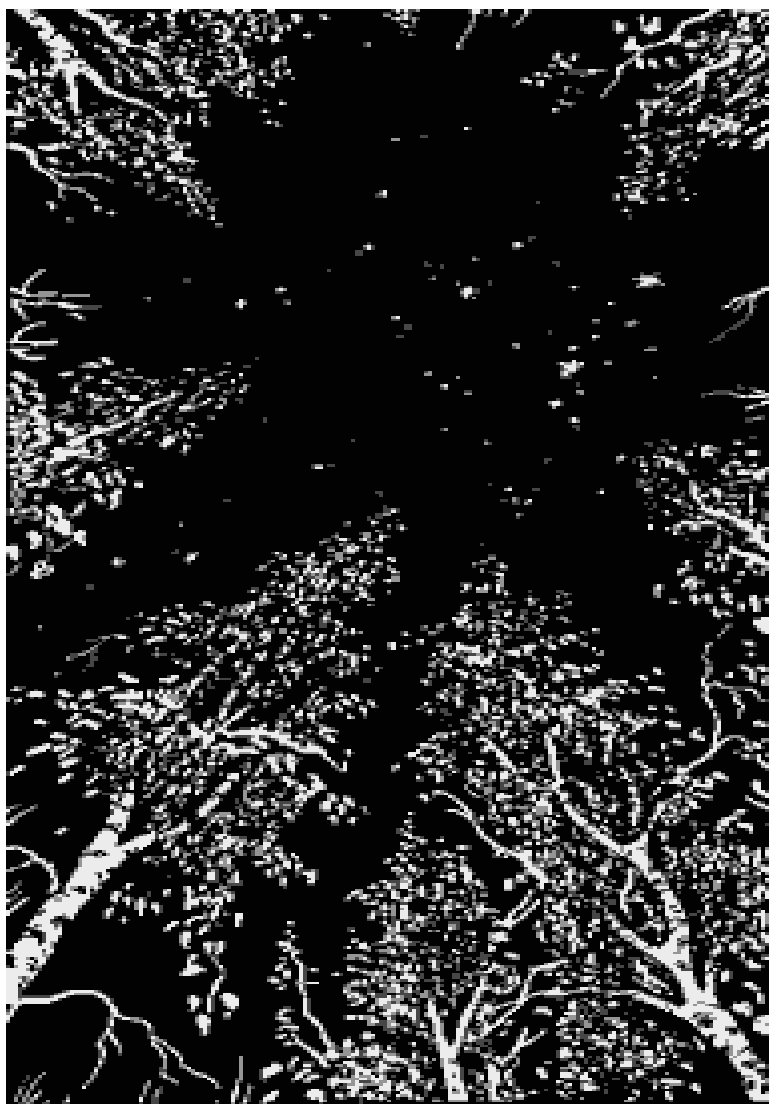
Иллюстрация из книги Виктора Гребенникова «Мой мир» (Иллюстрации в Интернете к данной книге формате Word на http://mezhybizh.info/ http://vedruss.ks.ua , http://letitbit.net/ , http://depositfiles.com и др.)