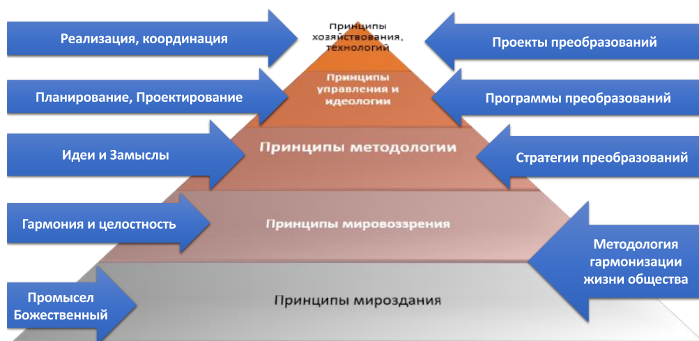
Рис.1. Логика принятия стратегических решений. Пирамида принципов.

Методологические и другие принципы, более подверженные изменениям по воле человека, используются уже после отбора стратегических решений на соответствие принципам мироздания и мировоззрения.