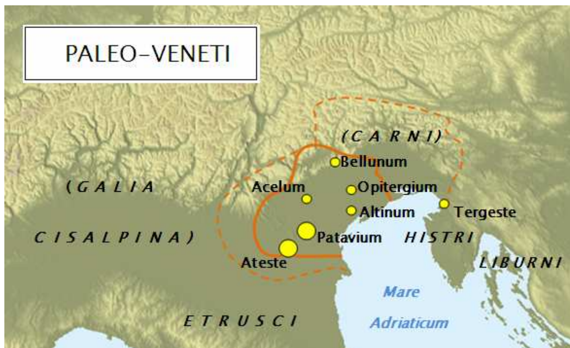
Рис.2. Карта проживания венетов и карнов.

был Атесте, ныне Эсте (рис.2). В 421 г. венеты построили на островах лагуны город Венецию (21). В настоящее время о венетах напоминают также названия залива Венецианский и регионов Венето и Фриули – Венеция – Джулия. Нами ранее было показано на примере семи расшифрованных текстов (9, с. 63-67;198-208), что венеты говорили на диалектном русском языке .