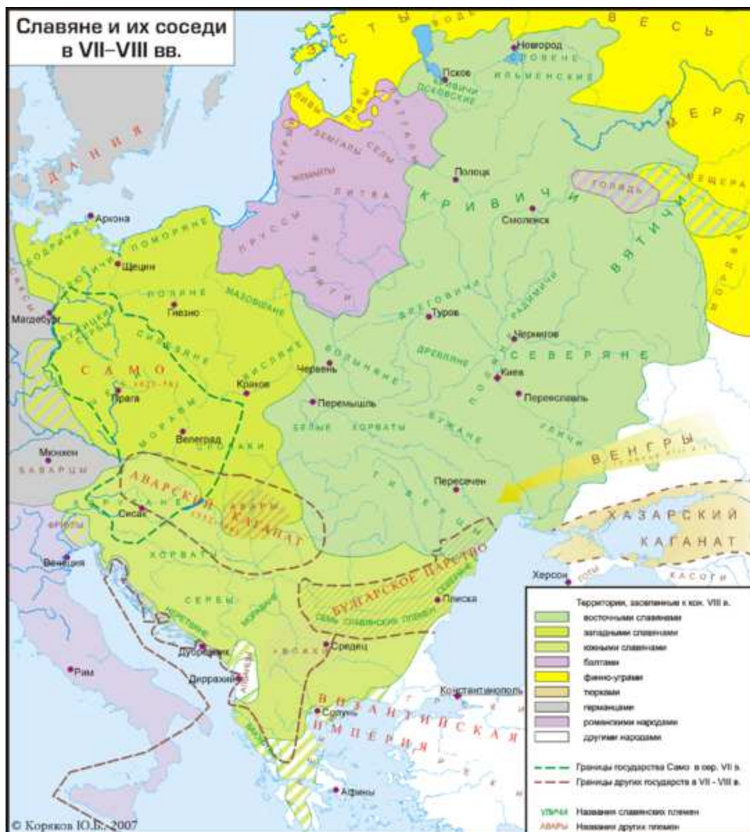
Рис. 6. File: Slav – 7 – 8 – obrez.png

ретийскому народу, несмотря на то, что им пришлось бежать от галлов, судьба в дальнейшем улыбнулась.