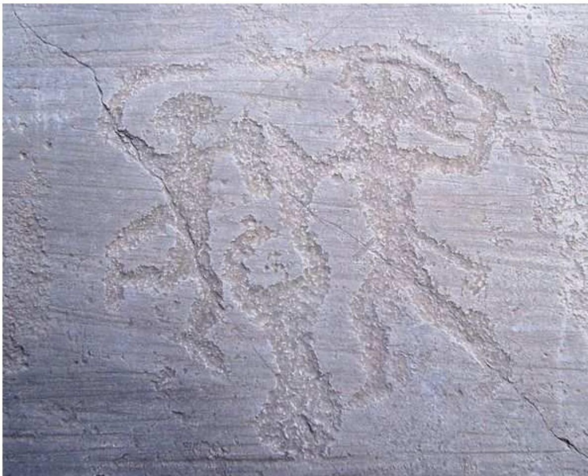
Рис.3. Петроглиф Валь-Камоники.

с.59). Плиний относит племя камунов к эвганеям , а Страбон – к ретам (22). Но эвганеи и реты были этрусками, поэтому камуны могли говорить на этрусском языке , т.е. на диалектном этрусском языке . На камунском языке сохранились надгробные и наскальные надписи, выполненные этрусскими буквами (22). На рис.3 показан один из многочисленных петроглифов Валь – Камоники со сценой битвы. На голове камуна имеется шлем в виде петушиного гребня. Такие шлемы носили этрусские воины еще в 7 в. до н.э. (9, с.24).