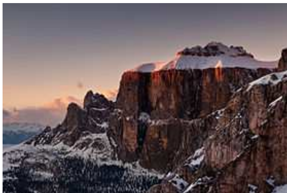
Рис.7. File: Gruppo del Sella.jpg

*****Топонимы Селла и ладины имеют славянскую природу. В слове ладины ударение на втором слоге. Массив Селла имеет плоскую вершину, на которой удобно сидеть. Вероятно, название массива связано с данным признаком. А название народа ладины происходит от слова лад – мир, согласие (5).