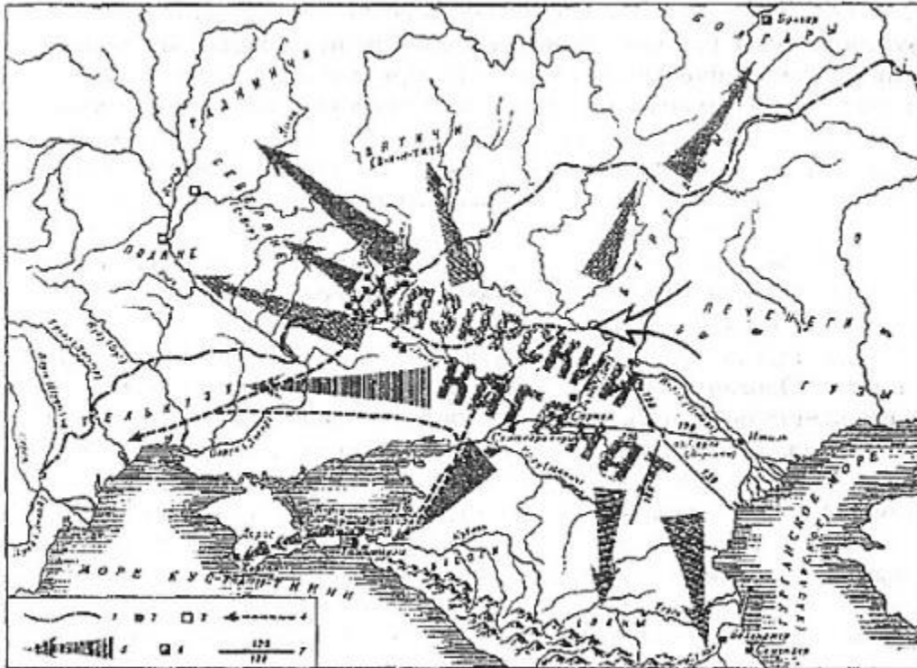
Хазария в VIII–X вв.

Ко времени описываемых событий большинство славянских племен оказалось под ярмом Хазарского каганата. Не довольствуясь эпизодическими, но сокрушительными набегами, хазары обложили полян, древлян, северян, вятичей и радимичей постоянной данью. Так продолжалось недолго. Русь крепла не по дням, а по часам, заставляя считаться с собой не только Хазарию, но и Византию. Стремительные русские ладьи стали хозяйничать на Черном, Азовском и Каспийском морях. В IX веке русский флот неоднократно появлялся у стен Царьграда. Против силы и напора русских дружин устоять было трудно — необходимо было искать другие пути, дабы обуздать и укротить Русь. Самый простой и надежный способ — идеологический дурман. И хазары засылают к всесильному киевскому князю эмиссаров-талмудистов, надеясь увлечь Владимира Красное Солнышко прелестями иудейской религии. Состоялся знаменитый диспут, обстоятельно описанный в «Повести временных лет»: