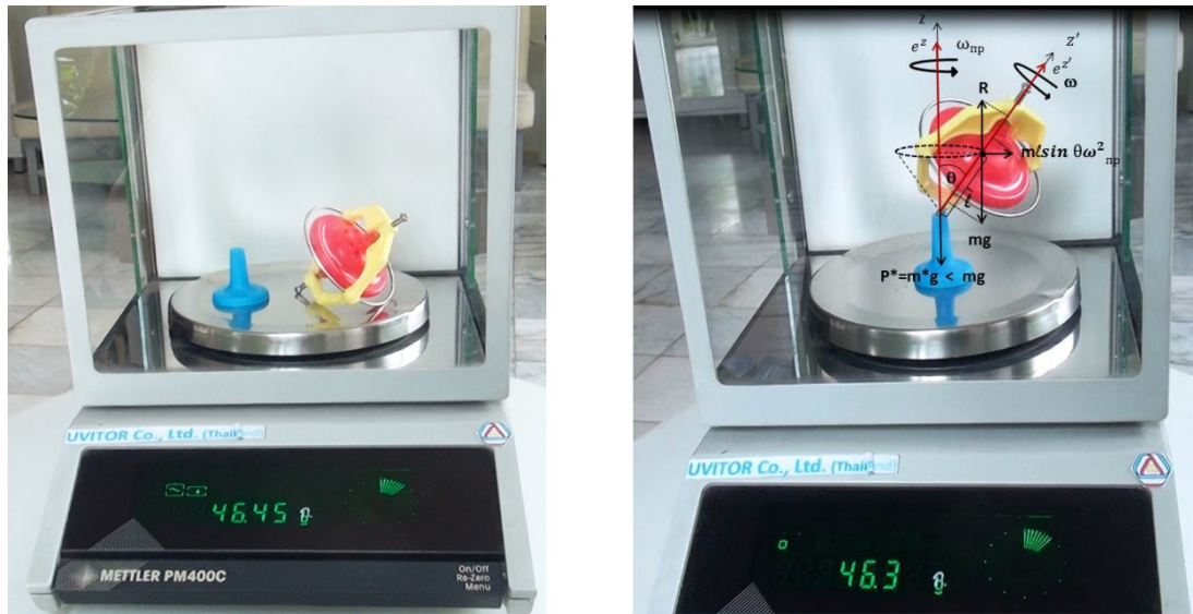
Рис.2. Потеря веса прецессирующим гироскопом

где \theta - угол прецессии, \omega_{np} = \mu l g / L - угловая скорость прецессии.